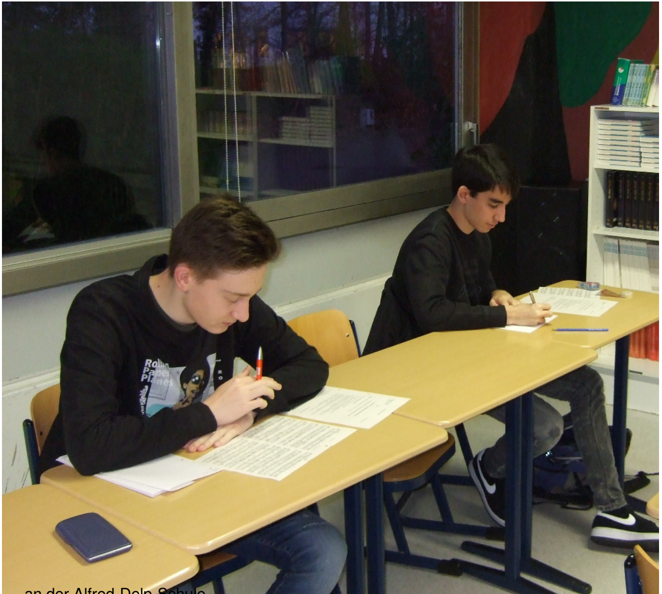
... an der Alfred-Delp-Schule